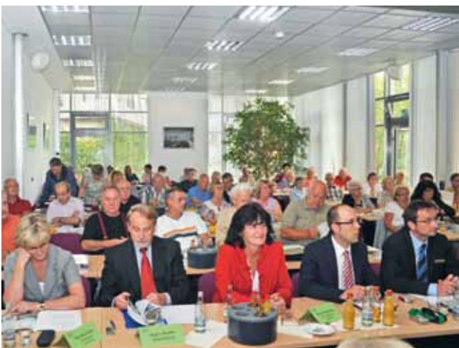
Gespannte Aufmerksamkeit: Vertreterversammlung des Jahres 2011.