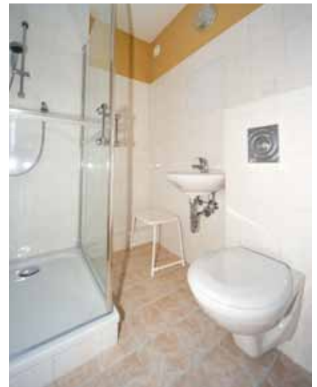
Die Musterwohnung zeigt am Beispiel, wie Bäder mit Hilfsmitteln für den alltäglichen hygienischen Bedarf eingerichtet werden können.