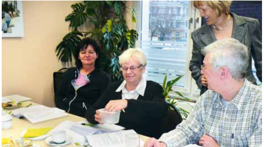
Der Wahlvorstand bei der Arbeit: 8. Wahlvorstandssitzung

Die Vertreterwahl fand im Briefwahlverfahren statt. 35,98 % unserer Mitglieder haben sich an der Vertreterwahl aktiv beteiligt. Von 143 Personen, die sich für die Vertreterwahl zur Wahl gestellt haben, wurden 91 Vertreter und 19 Ersatzvertreter in 11 Wahlbezirken gewählt.