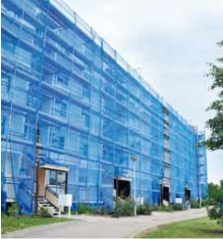
links: Am Alfred-Delp-Ring werden derzeit die Loggien erneuert.