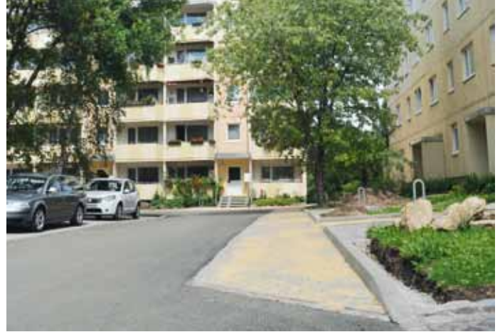
rechts: In der Bukarester Straße ist die Erneuerung der Zufahrt und Wege fertig gestellt.

Mit großen Schritten geht es auf unserer größten Baustelle – der Wohnanlage Christian-Kittel-Straße/Melchendorfer Straße – voran. Nachdem die Gerüste an den ersten Häusern bereits gefallen sind, laufen die Ausbau- und Ausrüstungsarbeiten in allen fünf Häusern auf Hochtouren. Unser Ziel ist es, die ersten drei Häuser entlang der Melchendorfer Straße Ende Oktober 2011 den zukünftigen Bewohnern zur Nutzung zu übergeben. Derzeit sind die Bohrarbeiten zur Erdwärmeversorgung in vollem Gang. Durch die beengten Baustellenverhältnisse ist das Baugeschehen gestaffelt, die Fertigstellung der beiden Häuser Christian-Kittel-Straße haben wir für den Dezember 2011 geplant. Die Außenanlagen werden witterungsbedingt im Frühjahr 2012 vollendet. Besonders erfreulich ist die hohe Akzeptanz für diese Wohnanlage, sowohl die Miet- als auch die Eigentumswohnungen sind fast alle vergeben.