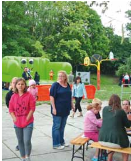
Spiel, Spaß und ein buntes Bühnenprogramm gab es zum Wohngebietsfest am Moskauer Platz (Bild oben) und am Roten Berg (Bild unten)